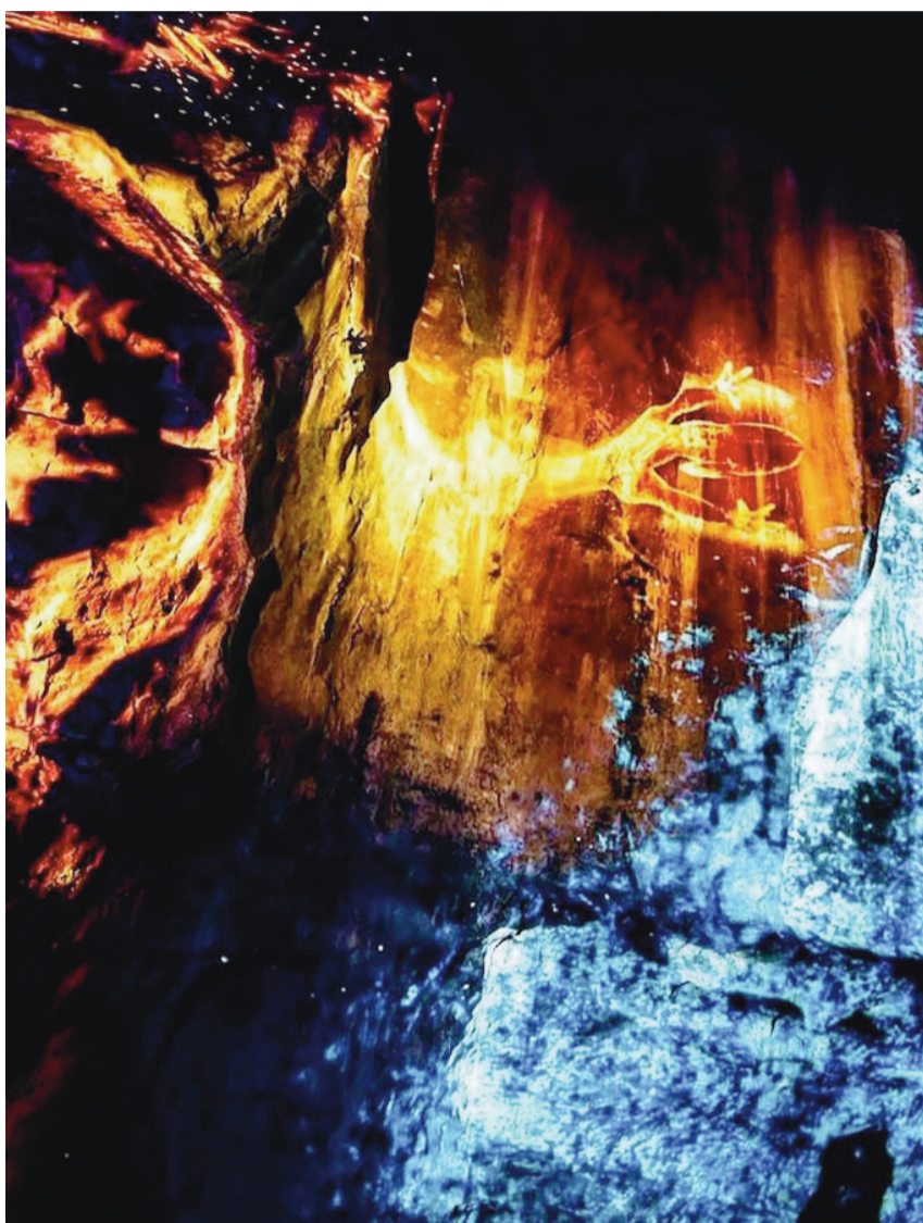
Steht kurz vor der zweiten Saison: Die Multimediashow Light Ragaz.