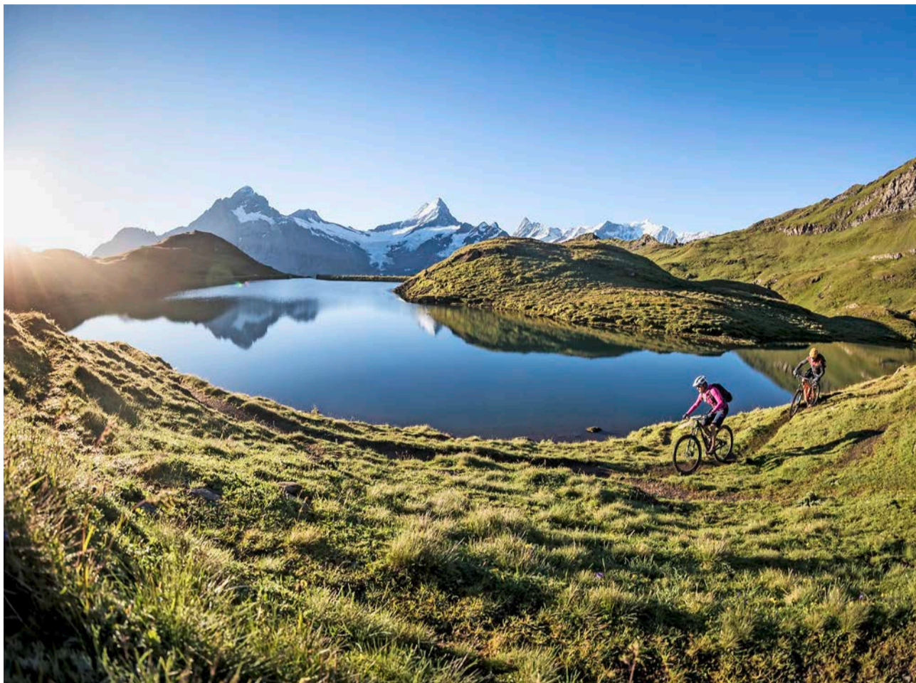
Beeindruckendes Panorama. Der Bachsee liegt auf 2265 Meter über Meer am Wanderweg vom First zur Schynige Platte