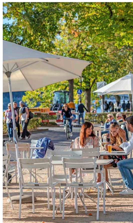
Glace, Bier und Pommes: An der Riviera sorgen die Buvetten, Basels berühmte Kioske, für Verpflegung

Infos: www.basel.com/city-package ; Inspirationen auf Social-Media: @baselschweiz #lovebasel #thisisbasel