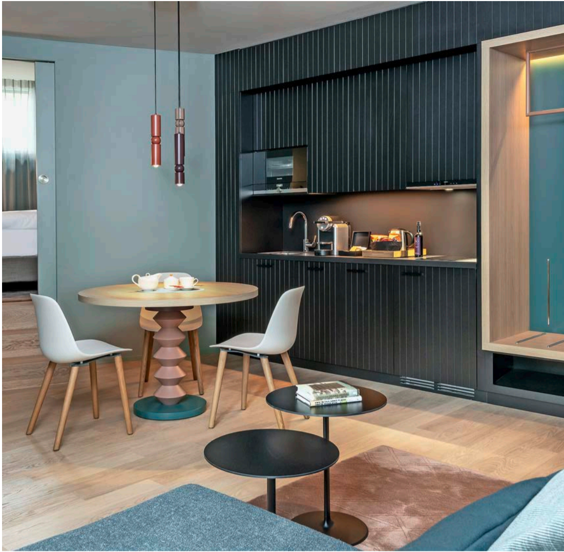
Neues Stadthotel mit Wohnzimmer-Ambiente: Das Sorell St. Peter in Zürich