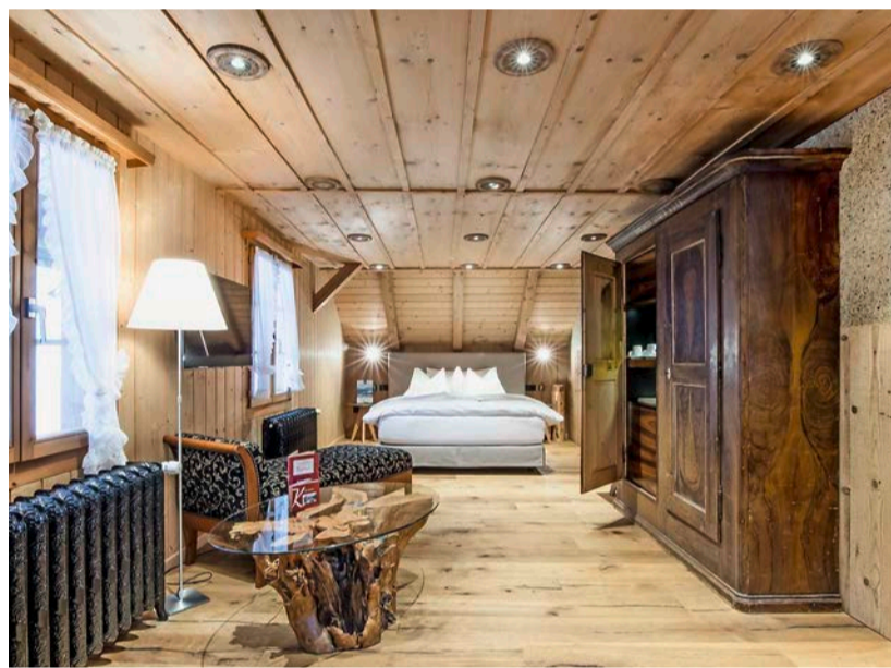
Mittelklassehotel auf Vierstern-Niveau: Landgasthof Kemmeriboden-Bad

aufbewahrt. Ansonsten setzt man auf Ursprüngliche. «Sie werden immer noch wie anno dazumal hergestellt und nur in den Varianten gross, klein oder mit Glace angeboten.»