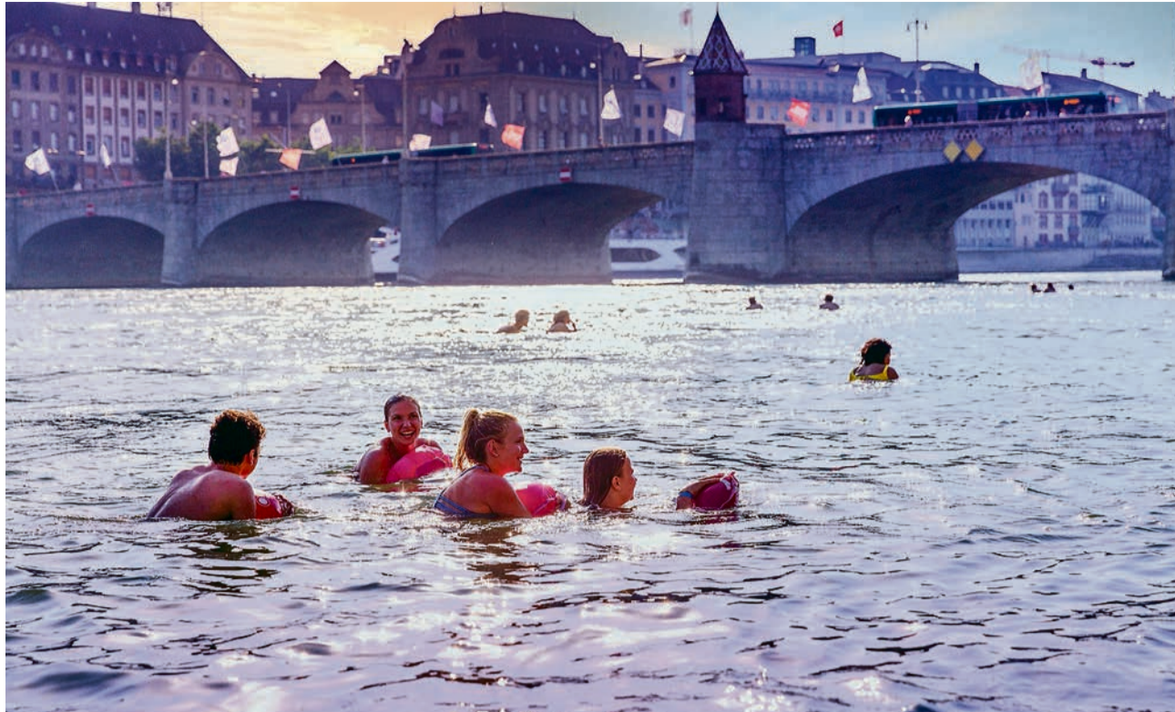
Im Sommer wird der Rhein zum Freiluftbad. Immer dabei: Der kultige Wickelfisch, ein wasserdichter Beutel für die Kleider

Sobald die Frühlingssonne das winterkalte Wasser aufgewärmt hat, stürzen sich Einheimische und wagemutige Besucher in das gurgelnde, smaragdfarbene Nass. Lassen Kleider, Röcke, Anzüge und jeglichen Standesdünkel fallen – im Rhein sind alle gleich. Frühmorgens, in der Mittagspause oder nach Feierabend: Hunderte von Menschen lassen sich täglich rheinabwärts treiben, vorbei an niedlichen Häusern, Grünanlagen, Museen, Restaurants und modernen Gebäuden von Stararchitekten wie Mario Botta oder Herzog & de Meuron. Rechts der einer Himmelstreppe gleichende Roche-Tower, das höchste Gebäude der Schweiz, links das gotische Münster, das über Grossbasel thront. Schwimmen als Sightseeing-Tour und fließende Meditation. Dabei gilt: Immer schön rechts halten! Die Fahrinne auf der linken Seite des Flusses gehört den Passagier- und Containerschiffen. Und obacht vor den Stand-up-Paddlern und Kajak-Fahrern!