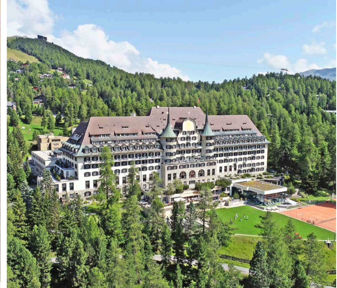
Very british: Das 1912 im Historismus-Stil erbaute Suvretta House westlich von St. Moritz