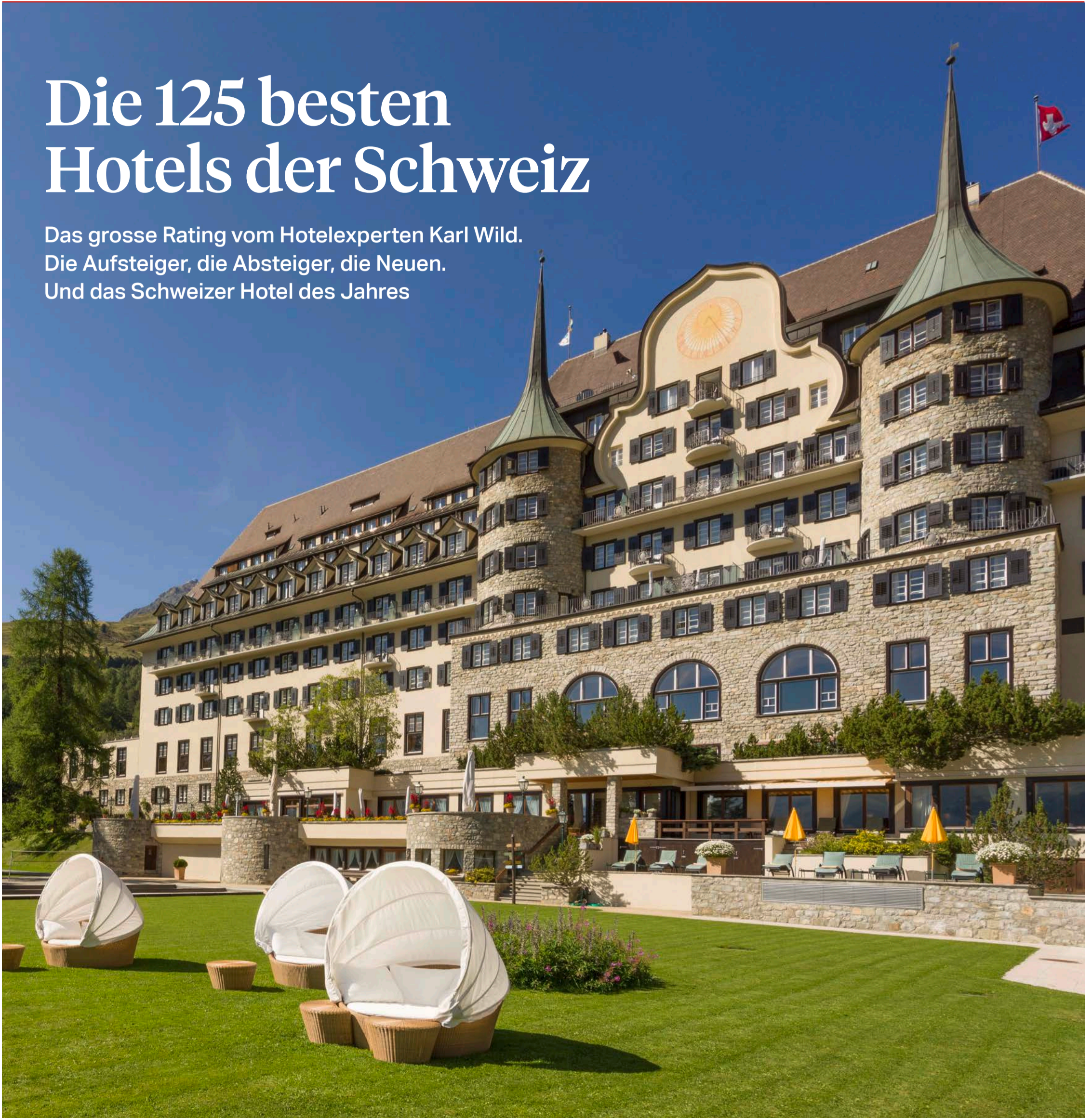
Hotel des Jahres: Das imposante Suvretta House bei St. Moritz wurde 1912 im Historien-Stil erbaut

Das grosse Rating vom Hotelexperten Karl Wild. Die Aufsteiger, die Absteiger, die Neuen. Und das Schweizer Hotel des Jahres