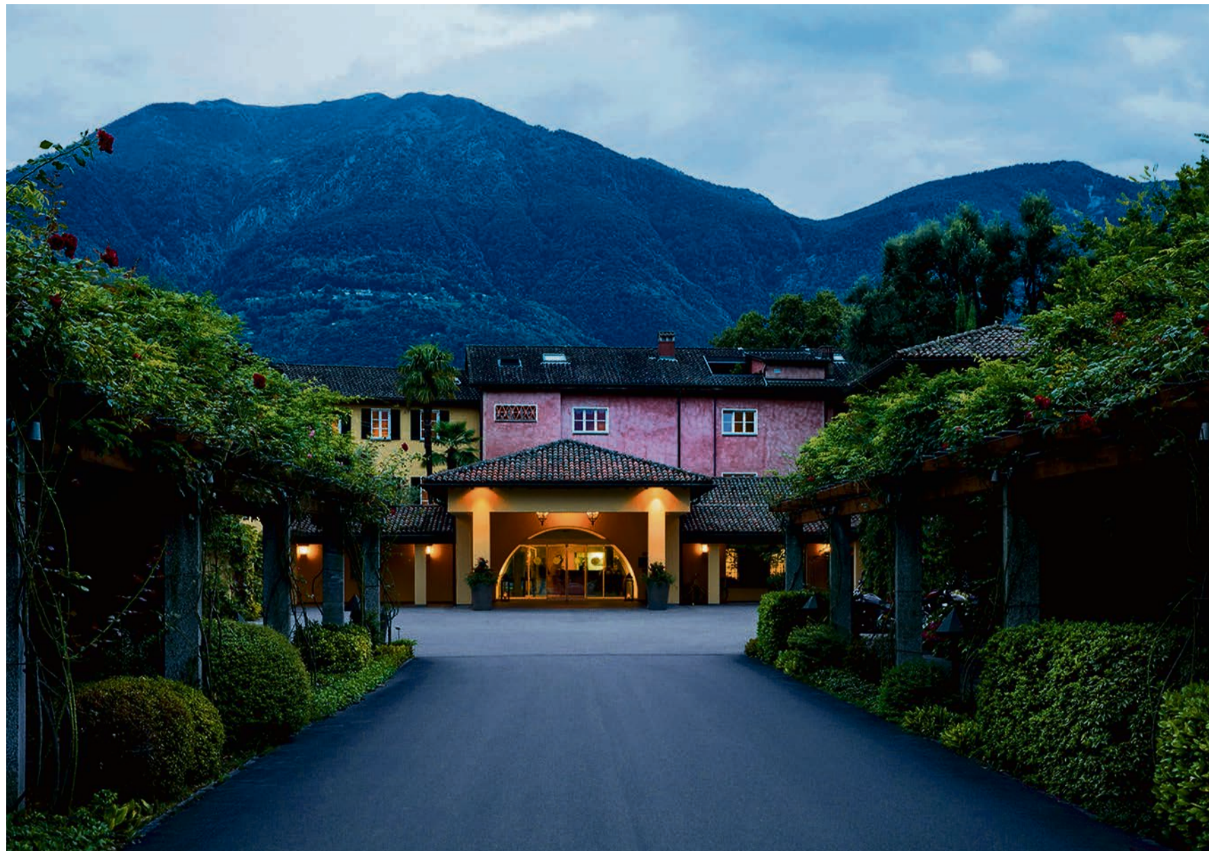
Atemberaubend schön: Das Castello del Sole in Ascona wurde erneut als bestes Ferienhotel der Schweiz ausgezeichnet