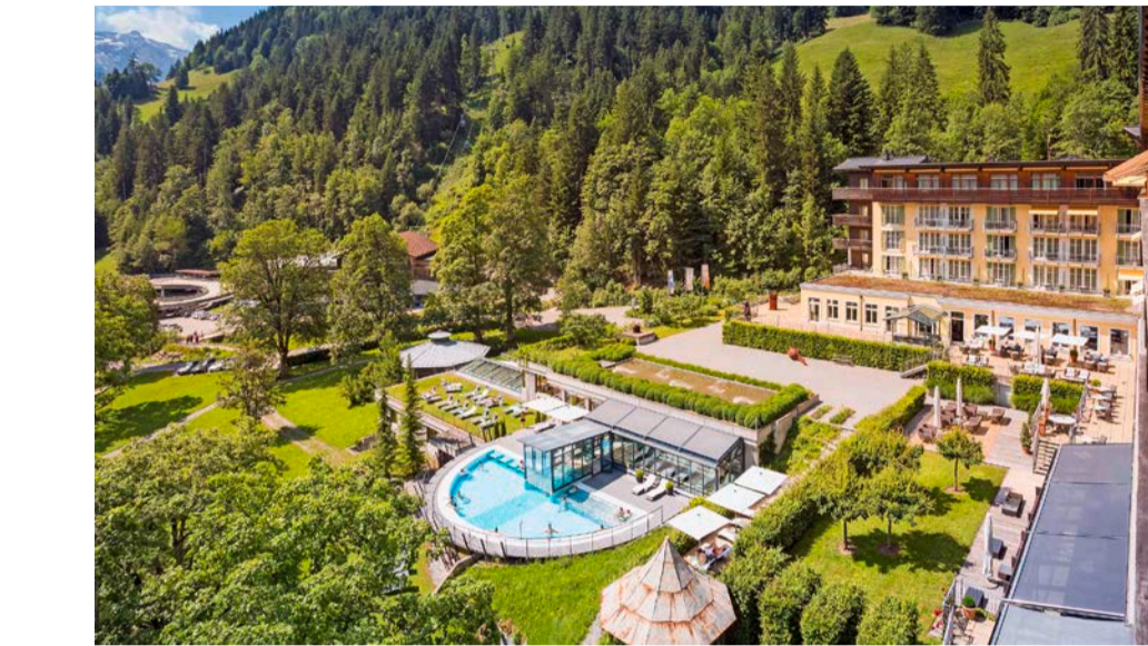
Abstandsregeln einhalten: Der weitläufige Park vom Hotel Lenkerhof bietet genügend Platz