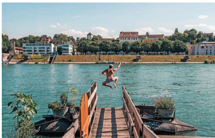
Hinein ins erfrischende Nass: Der Schiffsteg wird zum Sprungbrett

Dolce far niente im sommerlichen Basel: Die Riviera am Rhein ist Flaniermeile, Erholungs- und Strand zugleich