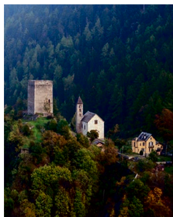
Bregaglia in der Region Maloja.

Die eindrucklichsten Bergtäler befinden sich oft abseits der ausgetretenen Pfade. Binntal, Valle di Muggio, Safiental, Valle Onsernone, Val Ferret oder Calanca gelten als Sehnsuchtsorte und Traumlandschaften. Was sie besonders faszinierend macht, ist die Kombination aus starker Urtümlichkeit und reizvollen Kulturlandschaften. Das Buch umfasst einen ausführlichen Serviceteil mit Wandervorschlägen, touristischen Informationen, Hinweisen auf Übernachtungs- und