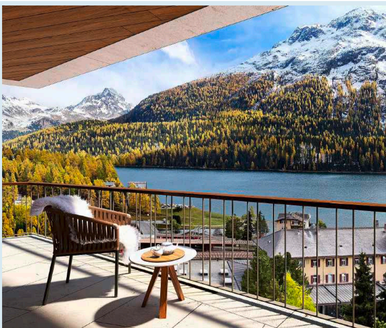
Laudinella. federico sette. Model Works Media London. Maistra160. Rendering Sunstar Hotel Pontresina, Garten.