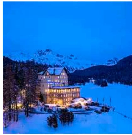
Waldhaus am see

4. (3) Jungfrau Wengernalp, Wengen Tél. 033 855 16 22, wengernalp.ch ch.d./d.p. 500 fr.