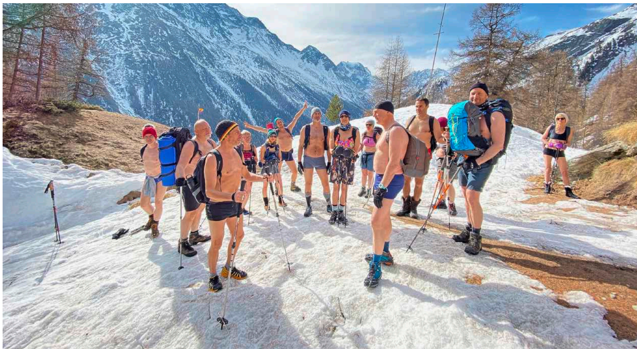
Vêtus d'un simple bikini ou maillot de bain et d'un bonnet, les participants partent pour une heure de balade dans la neige après le petit-déjeuner.